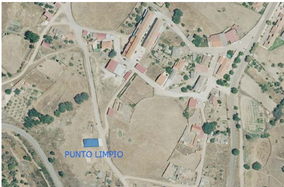
Localización del punto limpio.