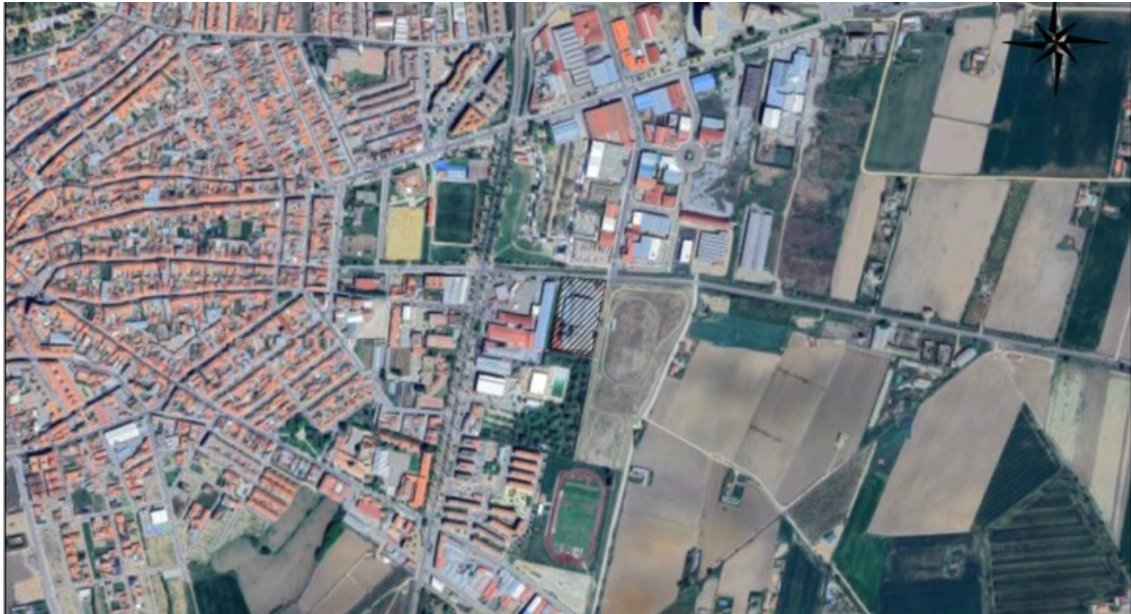
Fig. 1. Ubicación