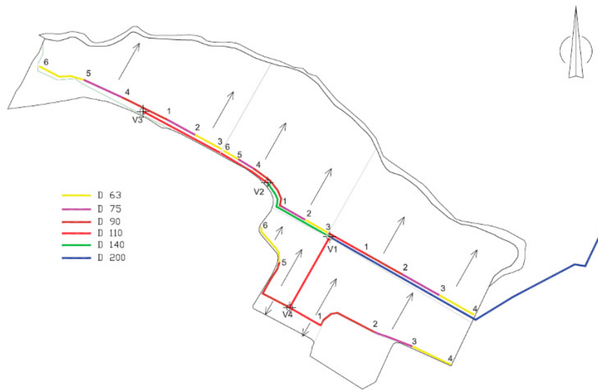
Características de la red de tuberías

Las características de las instalaciones son las siguientes: