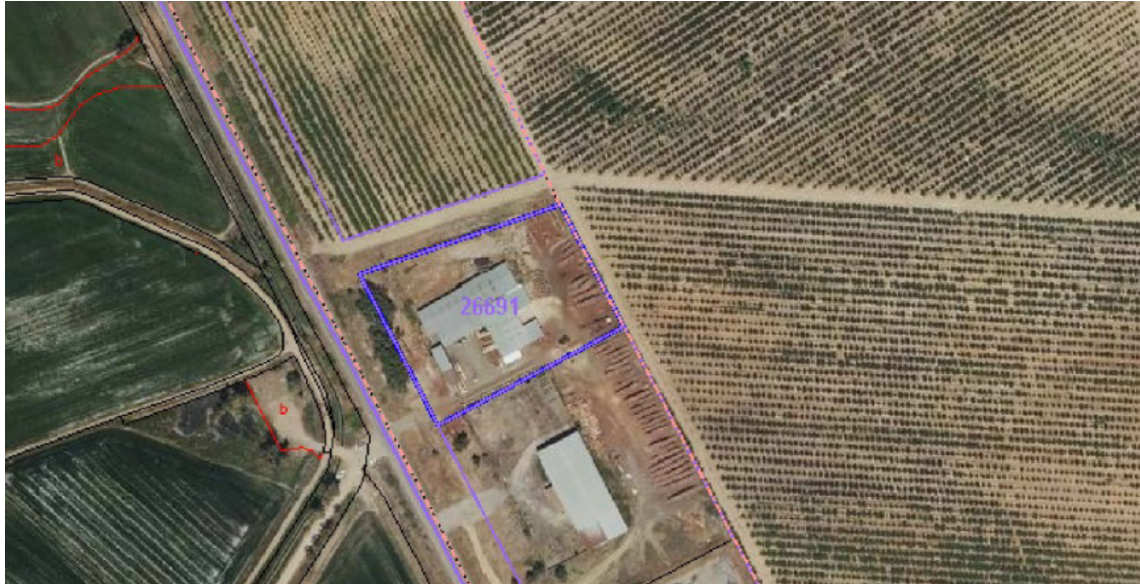
Fig. 1. Ubicación