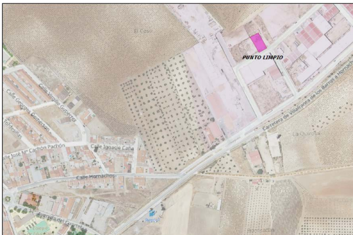
Localización del punto limpio.