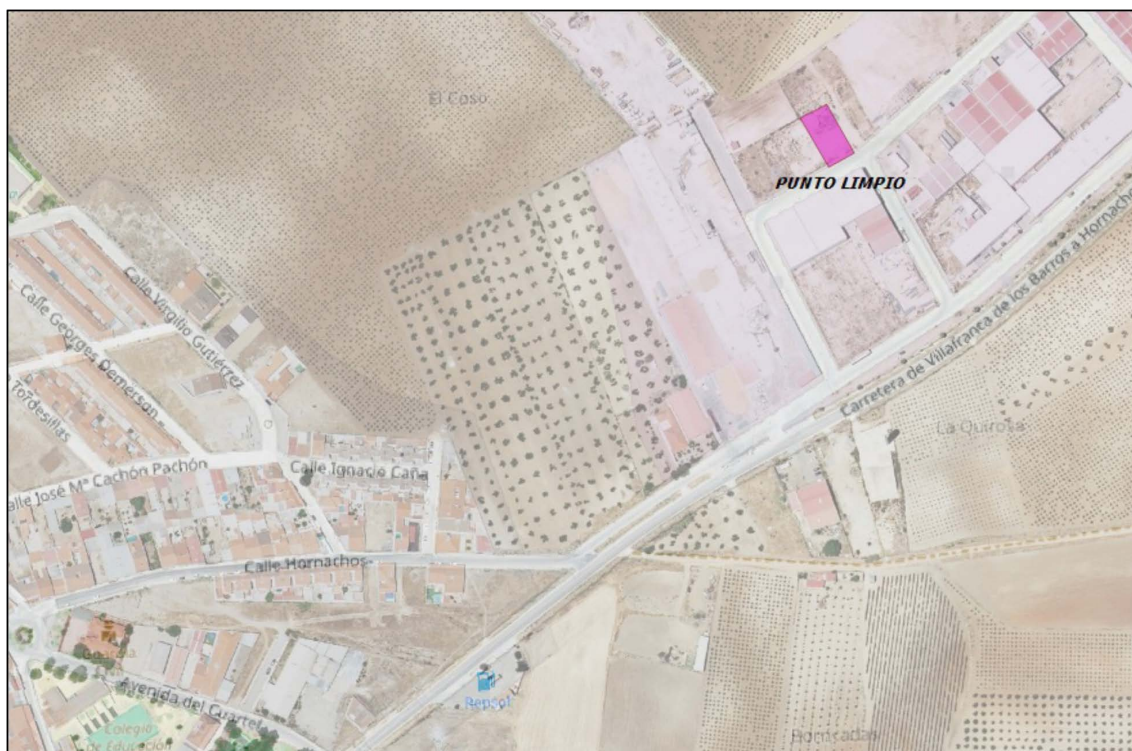
Localización del punto limpio.