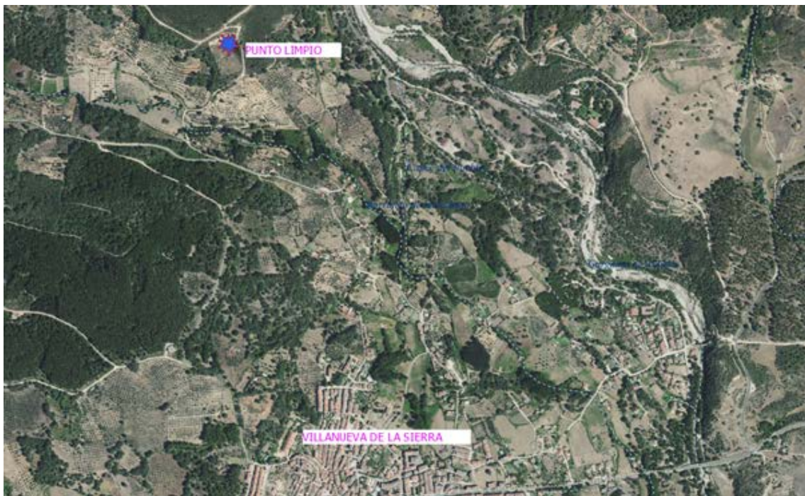
Localización del punto limpio.

La parcela ya está antropizada, desbrozada y con algunos contenedores de residuos. El relieve es montañoso, está en las estribaciones de la Sierra de Gredos y rodeada de olivares y monte bajo. El cauce más próximo es el Barranco del Helechoso, que dista más de 250 metros de la instalación. No está dentro de ningún espacio natural protegido, ni próximo a vías pecuarias y no se tiene conocimiento de restos arqueológicos próximos.