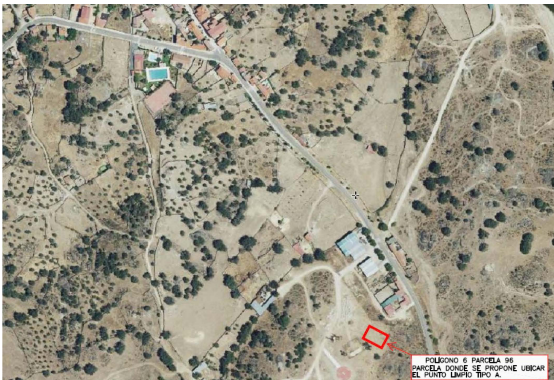
Localización del punto limpio.