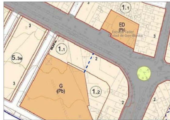
ORDENACIÓN URBANÍSTICA MODIFICADA