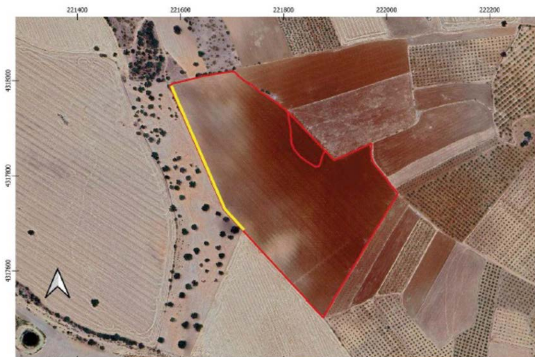
Plano 4: Búfer de 5 m en el margen oeste de la zona de actuación