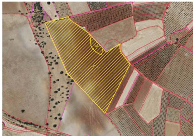
Plano 1: Plano general de emplazamiento.