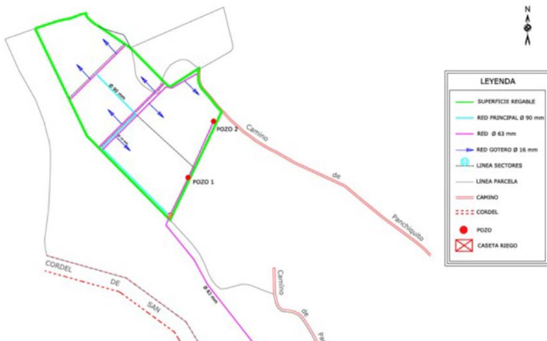
Plano 3: Distribución de las instalaciones de riego

Las características cartográficas del proyecto son las siguientes: