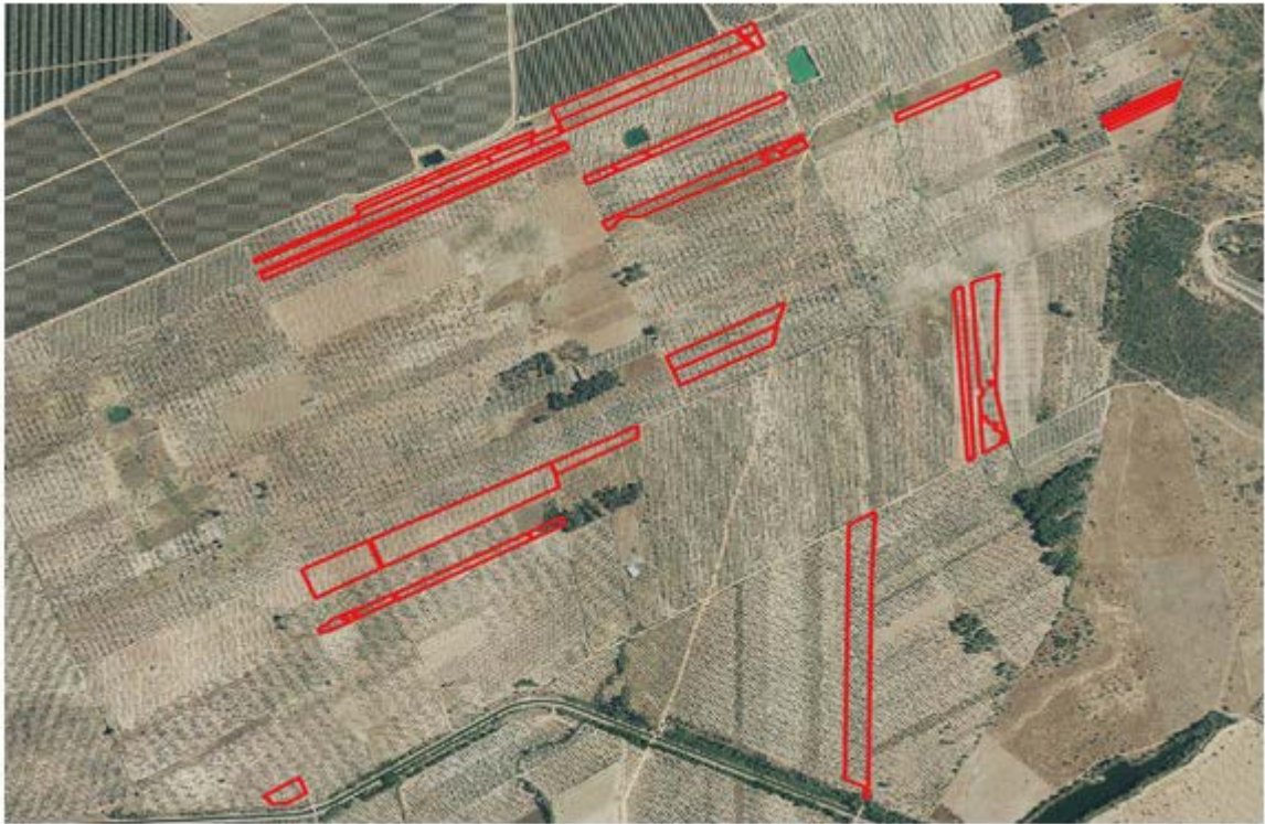
Plano 1: Plano general de emplazamiento.