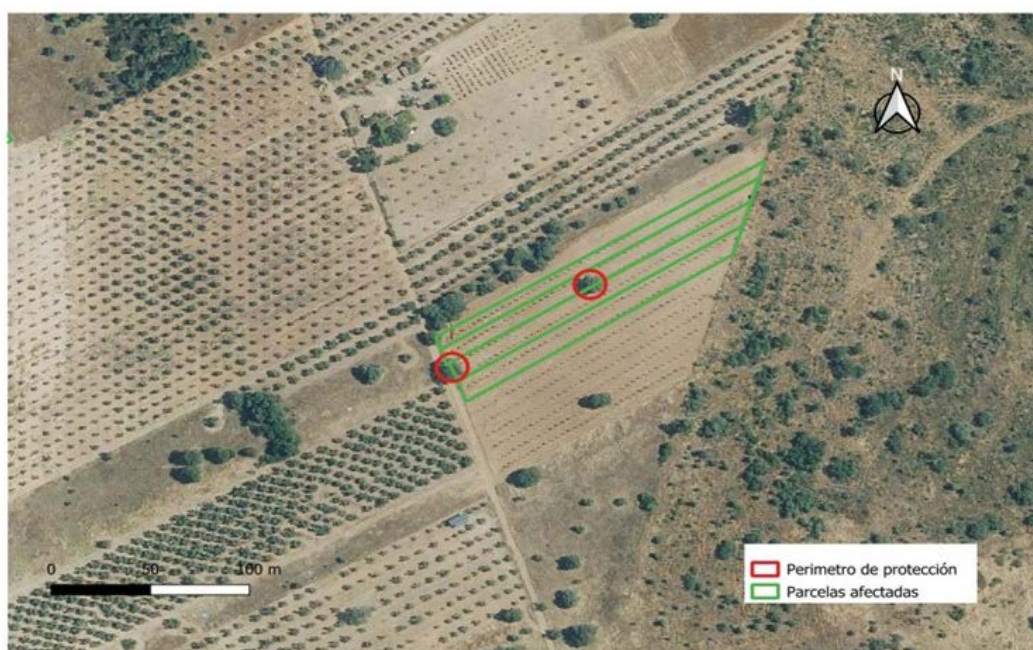
Plano 4. Zona de actuación (parcelas 162, 163, 164 y 160 del polígono 18) y perímetros de protección