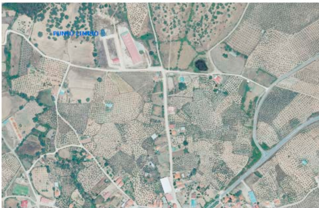
Localización del punto limpio.