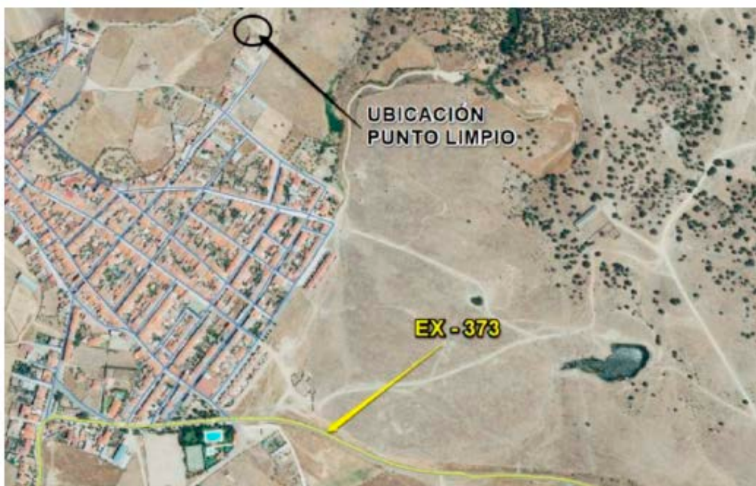
Localización del punto limpio.