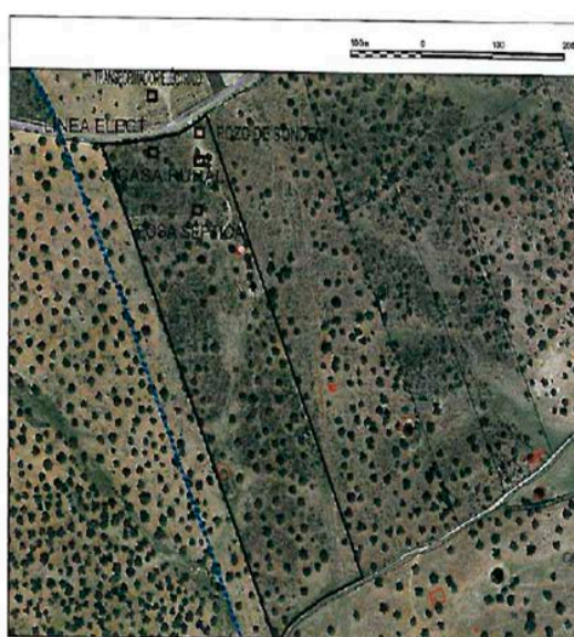
SITUACION E. 1/10000